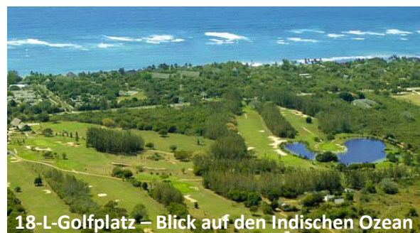
18-L-Golfplatz – Blick auf den Indischen Ozean